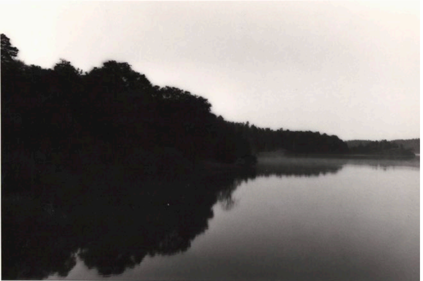
Drottningholm, Suède, 1988