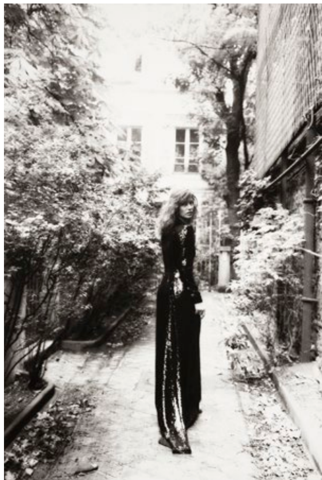
Jane Birkin, Paris, 1988

La Galerie Agathe Gaillard lui rend hommage et propose une exposition de rencontre entre cette nature théâtrale et ses femmes déifiées.