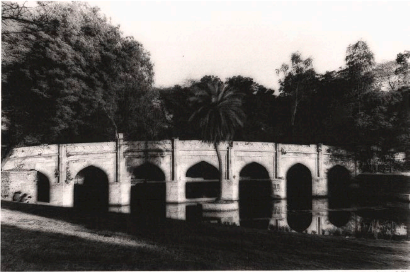
Lodi gardens, Inde, 1985