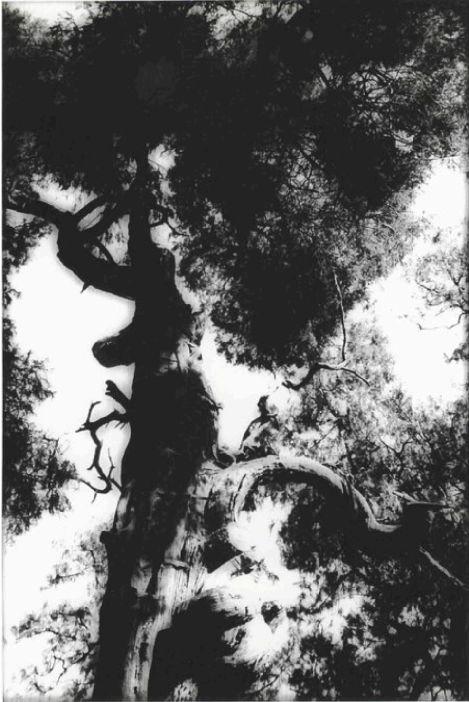
Souzou, arbre sacré, Chine, 2000