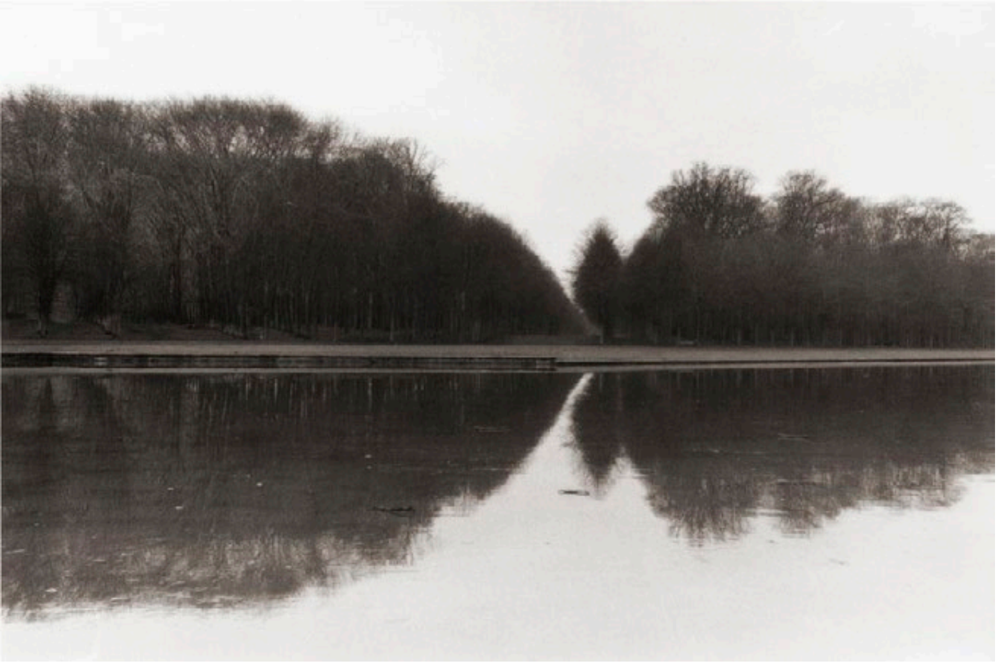
Versailles, France, 1980