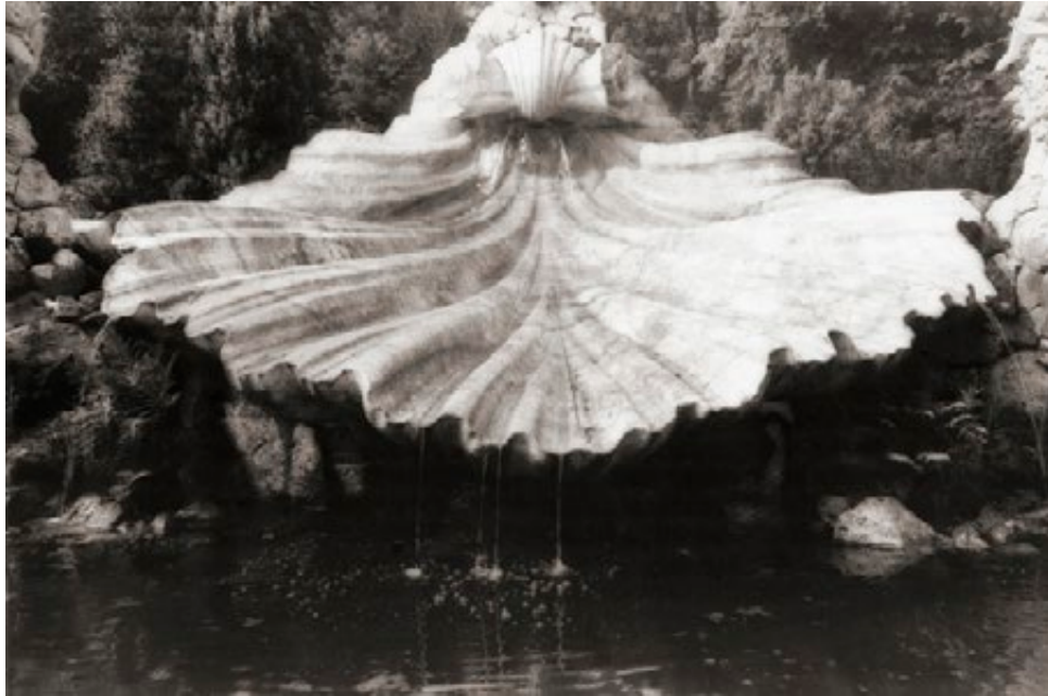
Cliveden, Angleterre, 1980