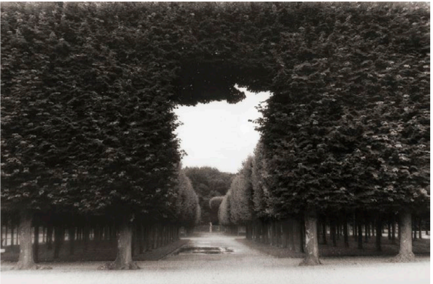
Rambouillet, France, 1978

De la même manière, Marguerite Duras dans le livre consacré à la série Les femmes les soeurs raconte des personnages et des lieux évanescents : «...l'inscription d'une tragédie latente, toujours, dans chaque photo elle est là, dans le ciel au-dessus des femmes, la mer. L'espace quel qu'il soit est ici toujours un espace du voyage relatif, sursitaire. »