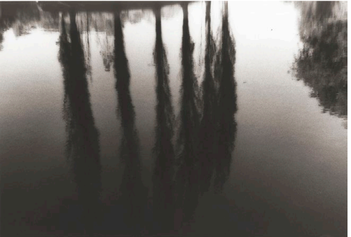
Ermenonville, France, 1988