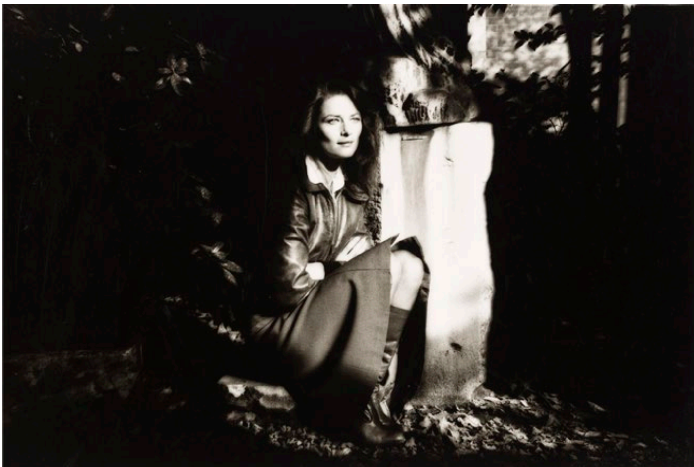
Charlotte Rampling, 1978