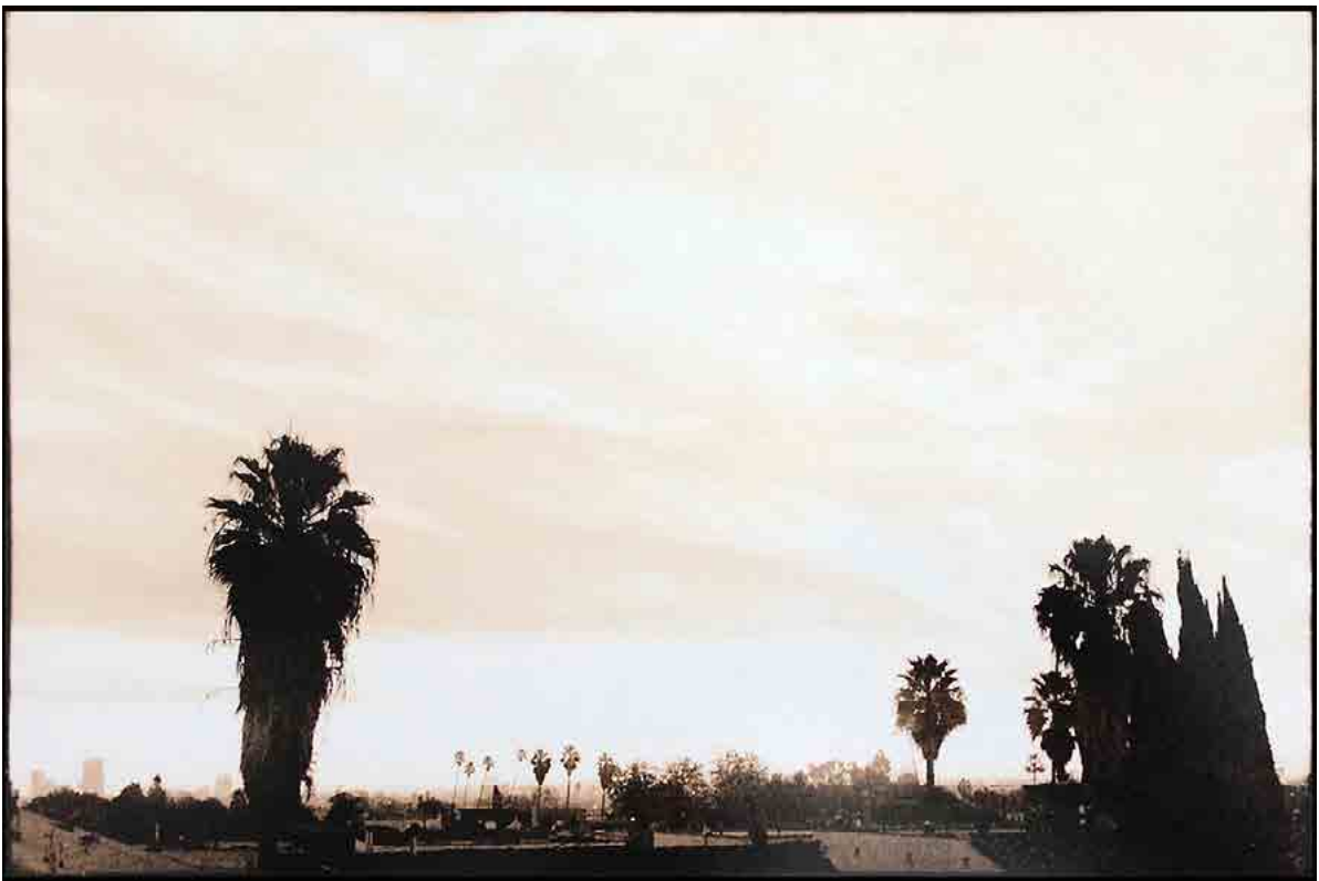
Palm Trees & Cars, 2010