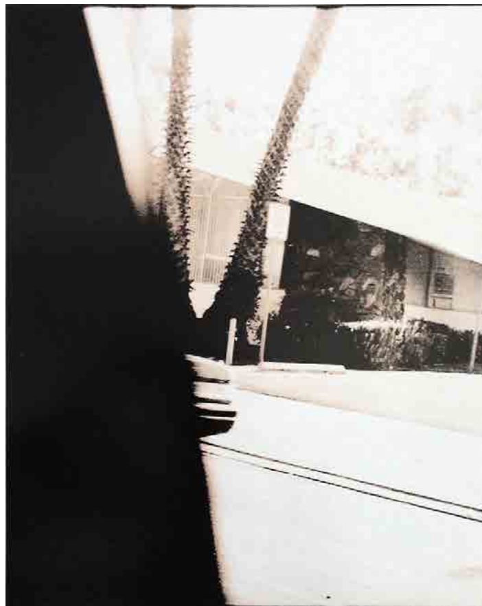
Palm Trees & Cars, 2010